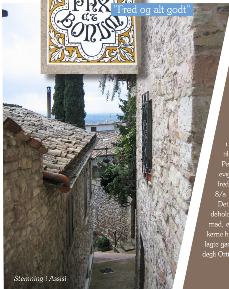
Stemning i Assisi

"Ved at efterleve fattigdomsprincippet stræbte Frans efter glæde og fred"