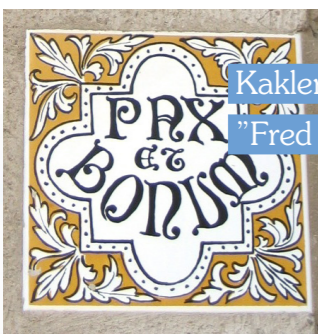
Kakler fra Assisi: "Fred og alt godt"

I juli 1228 blev Frans af Assisi udråbt til helgen af pave Gregory IX.