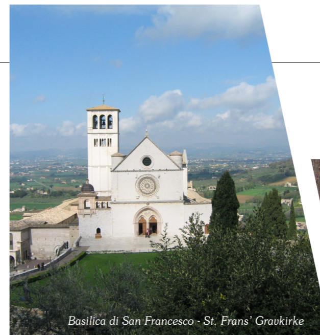
Basilica di San Francesco - St. Frans' Gravkirke

Det er nemt at finde klassisk italiensk mad mange steder i Assisi. Mad, der indeholder meget af deres hvide mel. Hvis man er mere til grøntsager og vegetarisk mad, er det muligt at finde en vidunderlig italiensk familierestaurant, der leder tænkningen hen til Walt Disneys "Lady of Vagabonden", i en af de ganske små brostensbelagte gader i Assisi. Restauranten ligger også nær Claras kirke og hedder "Ristoranti degli Orti".