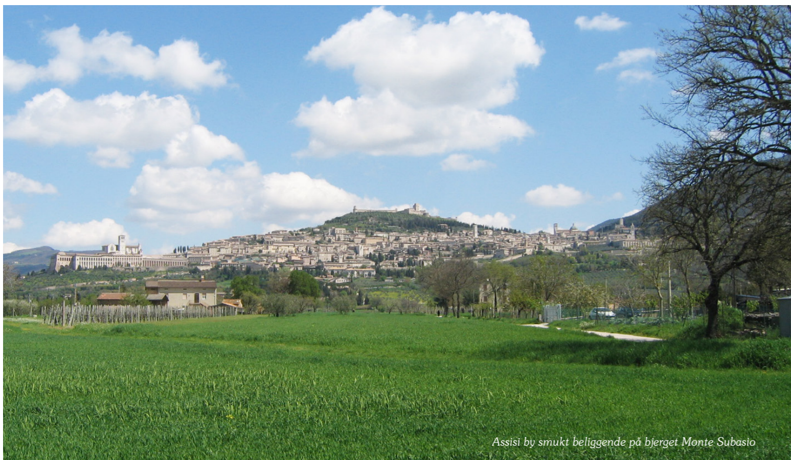
Assisi by smukt beliggende på bjerget Monte Subasio

Assisi er en lille by, som man finder midt mellem Firenze og Rom i Italiens grønne hjerte 'Umbrien'. Byen har ikke mange flere end 6000 indbyggere, men besøges hvert år af op mod 5 millioner pilgrimme.