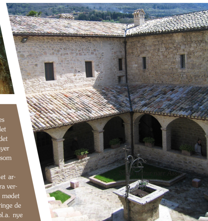
Klosteret ved Sankt Damians kirke, hvor Frans hørte det talende kors

Assisi er også blevet et sted, der er særdeles kendt inden for verdensreligionerne, idet byen d. 27. oktober 1986 var vært for det store fredsmøde: "The World Day of Prayer for Peace" og den interreligiøse dialog, som udsprang af dette fredsmøde.