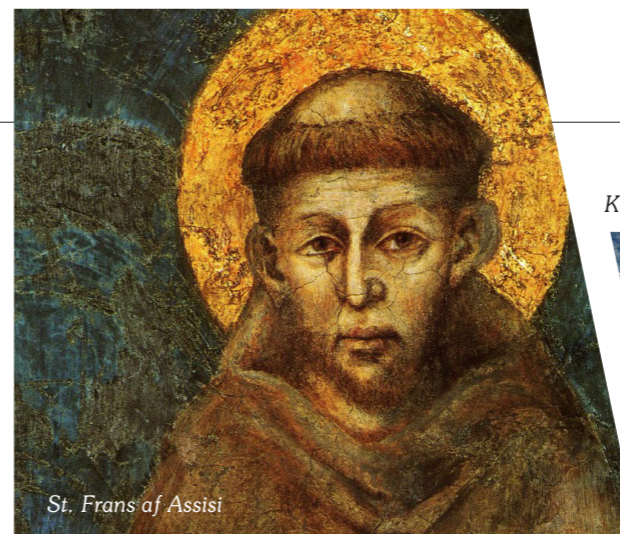
St. Frans af Assisi

Byen er især kendt for den hellige Frans af Assisi, der levede i denne by og på bjerget i nærheden, og ligeledes for hans kvindelige modstykke Clara af Assisi.