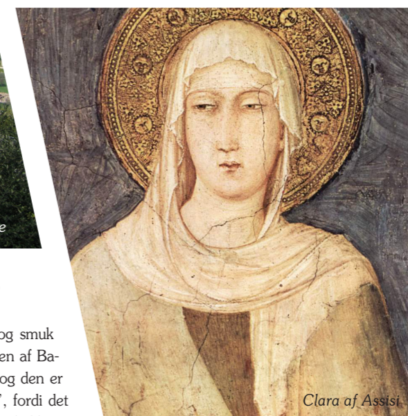
Clara af Assisi

Der er en vidunderlig intens energi inde i dette lille kapel. I nærheden af kapellet inde i basilikaen kan man se, hvor Frans døde. Dette sted har tidligere været et smukt lille lund- og skovom-