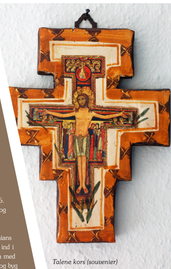
Talene kors (souvenir)

En dag, da Frans var ude i naturen for at meditere i nærheden af Sankt Damians kirke, som var en meget gammel og nedslidt kirke, blev Frans pr. intuition ført ind i kirken for at bede. Han knælede foran det byzantinske krucifiks og bad. Da han med tårer i øjnene så op mod den korsfæstede Herre, hørte han en stemme: "Gå ud og byg min kirke op, du ser jo, den ligger i ruiner."